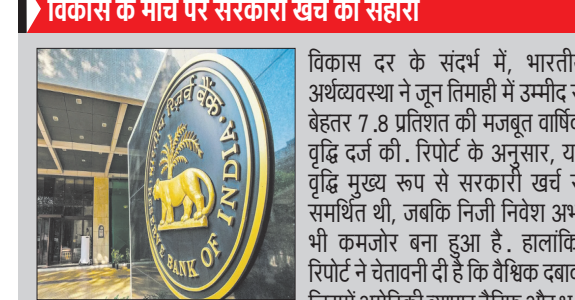
राजनीतिक तनाव शामिल है।

मौद्रिक नीति समिति में विकास और वैश्विक जोखिमों पर संतुलन की तैयारी अगस्त में उपभोक्ता मूल्य मुद्रास्फीति बढ़कर 2.07% पर