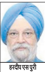
हरदीप एस पुरी

प्रधानमंत्री नरेन्द्र मोदी की करिश्माई उपस्थिति और संगठनात्मक नेतृत्व की भरपूर प्रशंसा की गई है, लेकिन जिस बात को कम ही लोग जानते और समझते हैं, वह यह