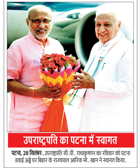
उपराष्ट्रपति का पटना में स्वागत

पटना, 28 सितम्बर. उपराष्ट्रपति सी.पी. राधाकृष्णन का रविवार को पटना हवाई अड्डे पर बिहार के राज्यपाल आरिफ मो. खान ने स्वागत किया।