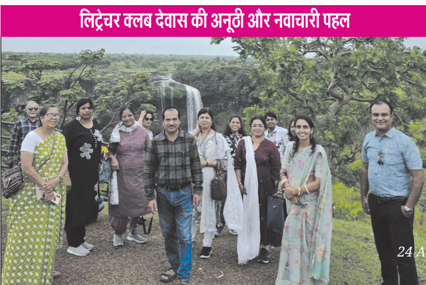
लिट्रेचर क्लब देवास की अनूठी और नवाचारी पहल

चादरें बिछी नजर आती थी जो आँखों के साथ मन को भी अजब - गजब सा सुकून दे रही थी. उन्हीं पहाड़ियों के बीच जगह - जगह गिरते पानी के छोटे बड़े झरने मन को आल्हादित किये जा रहे थे. सपाट जगहों पर पत्थरों के उपर से तेजी से बहता पानी कल - कल के अनूठे स्वर पैदा कर रहा था, जिसे सुन संगीत के अनोखे स्वरों का अहसास होता था. ऐसे नजारों को पहले फिल्में में ही देखा था जिन्हें अपनी नजरों के सामने होता देख आनंद