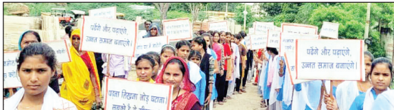
कैलारस में नवभारत साक्षरता अभियान के तहत आयोजन

नवभारत न्यूज मुरैना/कैलारस, 2 सितम्बर। जनपद शिक्षा केंद्र कैलारस के तहत असाक्षरों को साक्षरता के