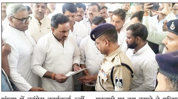
रतलाम में हुए हमले के विरोध में कांग्रेस कमेटी ने दिया ज्ञापन

नवभारत न्यूज मुरैना, 2 सितम्बर। कांग्रेस के प्रदेशाध्यक्ष जीतू पटवारी पर 31 अगस्त को रतलाम में हुए हमले के विरोध में जिला कांग्रेस कमेटी की