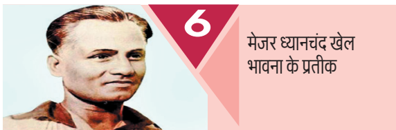
6 मेजर ध्यानचंद खेल भावना के प्रतीक