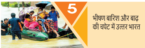
5 भीषण बारिश और बाढ़ की चपेट में उत्तर भारत