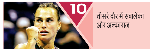
10 तीसरे दौर में सबालेंका और अल्टकाराज