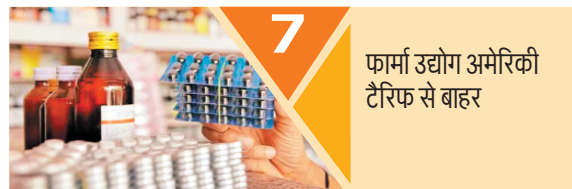
7 फार्मा उद्योग अमेरिकी टैरिफ से बाहर