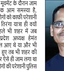
रवैया ठीक नहीं है।