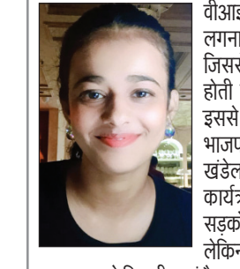
प्रशासन को दिखती कहां है।