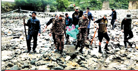
प्रस्तावित कार्यों में आधे से अधिक पूर्ण : गडकरी

कि ये सभी लोग पूरी तरह से सुरक्षित हैं. इनको उत्तरकाशी और देहरादून लाया जा रहा है. इसके अतिरिक्त, वर्तमान तक 135 लोगों को सुरक्षित हर्षिल से बाहर निकाला गया, जिसमें से 100 लोगों को उत्तरकाशी पहुंचाया गया है. 35 लोगों को देहरादून सुरक्षित भेजा गया है. उन्होंने बताया कि इस प्रकार कुल 135 लोगों को सफलतापूर्वक रेस्क्यू कर सुरक्षित गंतव्य तक पहुंचाया जा चुका है और 274 लोगों को हर्षिल में बाहल फटने से धराली गांव में भारी तबाही हुई थी. बचाव दलों ने दो शव बरामद किए और कई को सुरक्षित बाहर निकाला.