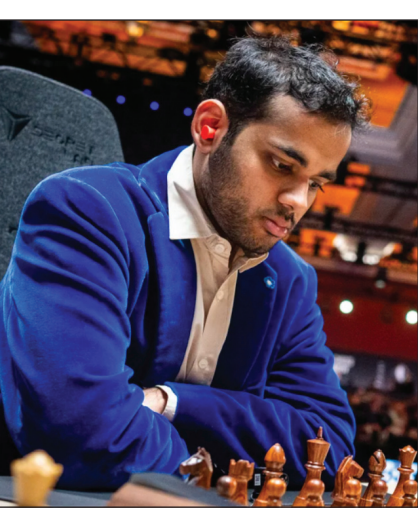
खासकर जब खिलाड़ी शास्त्रीय टूर्नामेंट में लंबी सोच में चले जाते हैं।

एरिगैसी ने कहा, फ्रीस्टाइल खेलना बहुत ताजगी भरा है, जिसमें कोई तैयारी नहीं होती और पहले ही चाल से खेल शुरू हो जाता है। मुझे लगता है कि शतरंज सर्किट में फ्रीस्टाइल ग्रींड स्लैम दूर का होना अच्छा है, और मुझे उम्मीद है कि यह जारी रहेगा।