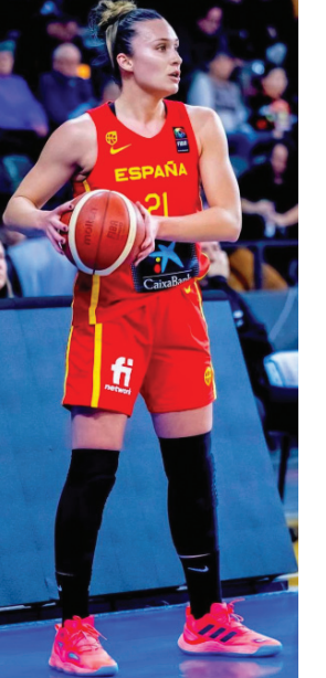
टीमवर्क, आदतों और संवाद पर फोकस बास्केटबॉल से पहले खेला फुटबॉल भी गिरोना टीम के साथ शानदार घरेलू सीजन

कैनेला का सफर कैनेला खुद टीम खेलों की प्रशंसक रही हैं और बचपन में फुटबॉल व बास्केटबॉल दोनों खेलती थीं, बाद में उन्होंने बास्केटबॉल को चुना। उन्होंने अपनी खेल करियर को अकादमिक शिक्षा के साथ सफलतापूर्वक संतुलित किया, और पेशेवर बनने से पहले मास्टर्स की डिग्री पूरी की। 2023 में गिरोना में शामिल होने के बाद, कैनेला का 2024-25 का घरेलू सत्र शानदार रहा, जहाँ उनकी टीम स्पार गिरोना स्पेनिश महिला बास्केटबॉल की शीर्ष डिवीजन एलएफ एंडेसा में शीर्ष पर रही। वह कड़ी मेहनत और विश्वसनीयता को अपनी फॉर्म की कुंजी मानती हैं, यह कहते हुए कि टीम की सफलता के लिए व्यक्तिगत प्रदर्शन से अधिक महत्वपूर्ण टीम के लिए योगदान देना है। कैनेला स्पेनिश जर्सी भी पहन चुकी हैं और 3x3 प्रारूप में अपनी पहचान बनाई है।