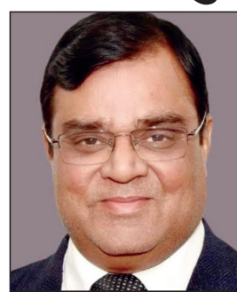
लापरवाही पर थाना प्रभारी निलंबित किए गए