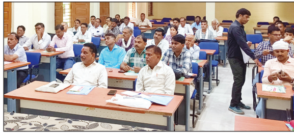
नवभारत न्यूज श्यापुर, 7 जुलाई। भारत निर्वाचन आयोग एवं मुख्य