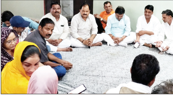
कि प्रदेश कांग्रेस के मुखिया पर दबंगों से पीड़ितों की मदद करने पर मोहन सरकार ने असत्य प्रकरण मुंगावली थाने में दर्ज कर लिया।