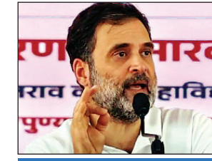
शिवाजी महाराज की मूर्ति गिरने पर राहुल ने पीएम मोदी को घेरा सीएम और डिप्टी सीएम ने पहले ही मांग ली थी माफी

मुंबई, 5 सितंबर. कांग्रेस नेता राहुल गांधी और पार्टी अध्यक्ष मल्लिकार्जुन खड़गे ने गुरुवार को महाराष्ट्र के सांगली में एक बड़ी जनसभा को संबोधित किया और केंद्र की सत्ताधारी गठबंधन महायुक्ति को निशाने पर लिया. छत्रपति शिवाजी महाराज की मूर्ति गिरने से जुड़ी घटना को लेकर कुछ दिन पहले ही महाराष्ट्र के सीएम से लेकर डिप्टी सीएम और पीएम मोदी तक ने माफी मांगी थी. राहुल गांधी ने शिवाजी महाराज की मूर्ति गिरने की घटना का जिक्र करते हुए कहा कि मैंने अखबार में पढ़ा था कि पीएम मोदी ने कहा था कि मैं शिवाजी महाराज की मूर्ति के गिरने पर