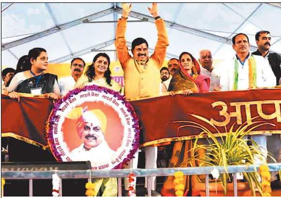
रोड शो के बाद लक्ष्मण मंदिर पहुंचे सीएम

अशोकनगर, 26 अगस्त. सोमवार को जन्माष्टमी पर्व के मौके पर मुख्यमंत्री डॉ. मोहन यादव जिले की पर्यटन नगरी चंदेरी पहुंचे। जहां उन्होंने सबसे पहले बुनकर पार्क पहुंचकर बुनकरों का हाल जाना. बाद में सीएम लक्ष्मण मंदिर पहुंचे और वहां पूजा की. इसके बाद सीएम ने रोड शो के जरिए स्थानीय लोगों का अभिवादन किया. रोड शो के बाद सीएम श्रीकृष्ण पर्व कार्यक्रम में सम्मिलित हुए. इस दौरान उन्होंने जिले को करोड़ों की सौगात दीं. उन्होंने कहा कि भारत के अंदर रहना है, तो राम-कृष्ण की जय कहना होगा. उन्होंने कहा सावधान.. जो यहां का खाता है, कहीं और का बजाता है, यह नहीं चलेगा. मुख्यमंत्री ने श्री कृष्ण पर्व कार्यक्रम का शुभारंभ दीप