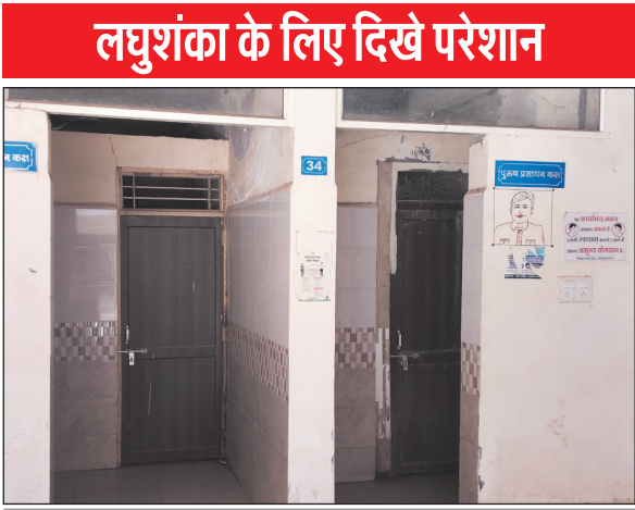
लघुशंका के लिए दिखे परेशान

दरअसल मंगलवार को आयोजित जनसुनवाई में अपनी विभिन्न समस्याओं को लेकर करीब 391 (लगभग चार सैंकड़ा) आवेदक पहुंचे थे. एक तरफ अधिकारी जनसुनवाई कक्ष में बैठकर लोगों की समस्याएं सुन रहे थे, तो दूसरी तरफ बाहर