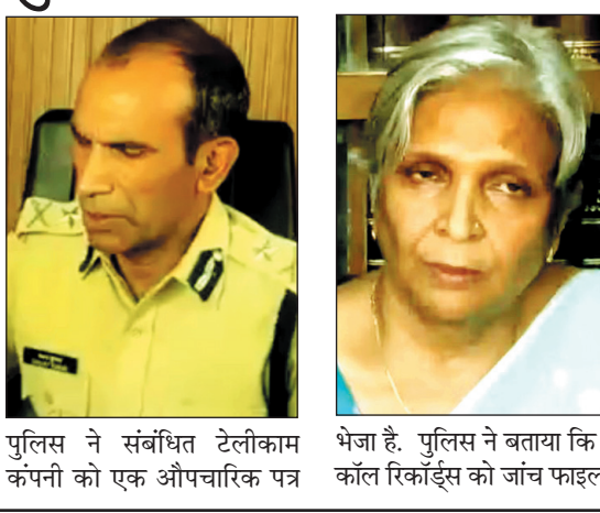
पुलिस ने संबंधित टेलीकाम कंपनी को एक औपचारिक पत्र भेजा है. पुलिस ने बताया कि इन कॉल रिकॉर्ड्स को जांच फाइल में