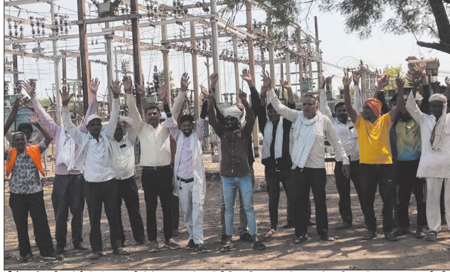
सीहोर. बिजली कटौती से परेशान ग्रामीणों ने शुक्रवार को बरखेड़ी स्थित विद्युत सब स्टेशन का घेराव किया और जमकर नारेबाजी की.

श्यामपुर क्षेत्र के दोराहा में मंडल अध्यक्ष एवं पदाधिकारियों के साथ जनप्रतिनिधियों ने विद्युत वितरण केंद्र पहुंचकर अधिकारियों के साथ बैठक की. बैठक में ग्रामीण क्षेत्रों में लगातार हो रही बिजली कटौती और विद्युत व्यवस्थाओं को लेकर आठ महत्वपूर्ण बिंदुओं पर चर्चा की गई. अधिकारियों ने भरोसा