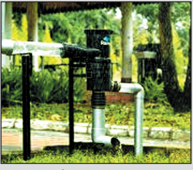
मकानों और कॉलोनियों में यह सिस्टम नहीं लगाये गए हैं. जबकि रेन वाटर हार्वेस्टिंग का नियम जून 2001 को अनिवार्य किया गया था जिस केंद्रीय भूजल प्राधिकरण ने आरो शहरी विकास मंत्रालय ने लागू किया था. भोपाल नगर निगम द्वारा इस नियम का पालन नहीं करा पा रहा है.

विजय शर्मा भोपाल, 20 मई. जल गंगा संवर्धन अभियान के तहत शहर और ग्रामीण क्षेत्रों में कुओं, बावड़ी, स्टांपडेम सहित अन्य जलस्रोतों को काफाई और जलीकरण का कार्य किया जा रहा है. जिससे जलस्तर को बढ़ाया जा सके. शहर में जलस्तर बढ़ाने के लिए मकानों में रेन वाटर हार्वेस्टिंग सिस्टम लगाना आवश्यक है, लेकिन नगर निगम की भवन अनुज्ञा शाखा रेन वाटर हार्वेस्टिंग के नियम का पालन करवाने में लापरवाह बनी हुई है. शहर के लगभग 80 प्रतिशत मकानों और कॉलोनियों में यह सिस्टम नहीं लगाये गए हैं. जबकि रेन वाटर हार्वेस्टिंग का नियम जून 2001 को अनिवार्य किया गया था जिस केंद्रीय भूजल प्राधिकरण ने आरो शहरी विकास मंत्रालय ने लागू किया था. भोपाल नगर निगम द्वारा इस नियम का पालन नहीं करा पा रहा है.