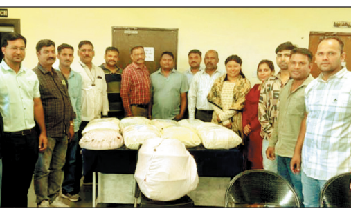
पंजाब मेल ट्रेन से अवैध मादक पदार्थ गांजा लेकर भोपाल पहुंचे 5 महिला और 2 पुरुष तस्करों को गिरफ्तार किया गया है. आरोपी इतने शांति थे कि पुलिस को भ्रमित करने के लिए गांजा परिवहन के दौरान अपने साथ घरेलू उपयोग का सामान जैसे प्लास्टिक की टोकरी, टप, तगाड़ी, पटा, बाल्टियां एवं अन्य सामग्री लेकर चल रहे थे, ताकि किसी को उन पर संदेह न हो सके. क्राइम ब्रांच को सूचना मिली थी कि कुछ महिला और पुरुष तस्कर पंजाब मेल ट्रेन से भारी मात्रा में गांजा लेकर भोपाल पहुंच रहे हैं और आउटर क्षेत्र में उतरकर करारिया जंगल के रास्ते पैदल-पैदल छोला क्षेत्र की ओर जाएंगे, जहां गांजा सप्लाय किया जाना है.