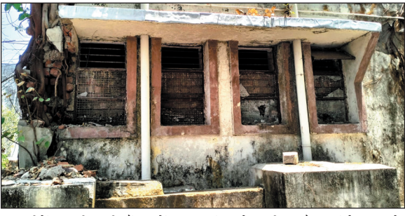
10 सीटें खाली पड़ी हैं। छात्रों का आरोप है कि पीजी और यूजी प्रवेश लंबे समय से बंद कर रखे गए हैं, जिससे ग्रामीण और आर्थिक रूप से कमजोर छात्रों को भारी परेशानी का सामना करना पड़ रहा है। इस

रोहित रजक भोपाल, 20 मई. राजधानी का वीवीआईपी माने जाने वाले श्यामला हिल्स क्षेत्र में सीएम हाउस से कुछ दूरी पर स्थित शासकीय डॉ. अंबेडकर अनुसूचित जाति महाविद्यालयीन छात्रावास की हालत बंद से बदनर होती जा रही है। छात्रावास में 50 सीट क्षमता होने के बावजूद वर्तमान में करीब 40 छात्र रह रहे हैं, जबकि लगभग