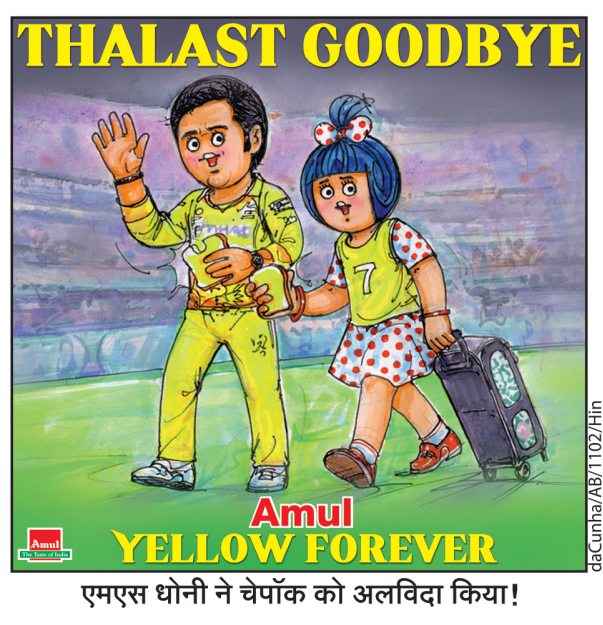
एमएस धोनी ने चेपाक को अलविदा किया!

वॉशिंगटन डीसी. अमेरिकी संसद ने मंगलवार को राष्ट्रपति डोनाल्ड ट्रम्प की सैन्य शक्तियों पर ब्रेक लगाते हुए एक महत्वपूर्ण प्रस्ताव पास कर दिया. इस प्रस्ताव के मुताबिक, अब ट्रम्प ईरान के खिलाफ किसी भी सैन्य कार्रवाई के लिए पहले कांग्रेस की मंजूरी लेंगे. वोटिंग में चार रिपब्लिकन सांसदों ने भी डेमोक्रेट्स का साथ दिया, जबकि तीन रिपब्लिकन सदस्य वोटिंग में अनुपस्थित रहे। प्रस्ताव 50-47 से पास हुआ इस कानून के लागू होने पर राष्ट्रपति केवल 60 दिन तक बिना संसद की अनुमति सैन्य कार्रवाई कर सकते हैं.