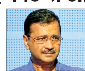
अरविंद केजरीवाल, मनीष सिसोदिया और दुर्गेश पाठक को चुनाव लड़ने से रोक दिया जाए और पार्टी का पंजीकरण रद्द किया जाए. याचिकाकर्ता ने आरोप लगाया कि नेताओं ने जस्टिस स्वर्ण कान्ता शर्मा की अदालत में चल रही कार्यवाही में हिस्सा लेने से इनकार किया, जो संविधान और जनप्रतिनिधित्व अधिनियम, 1951