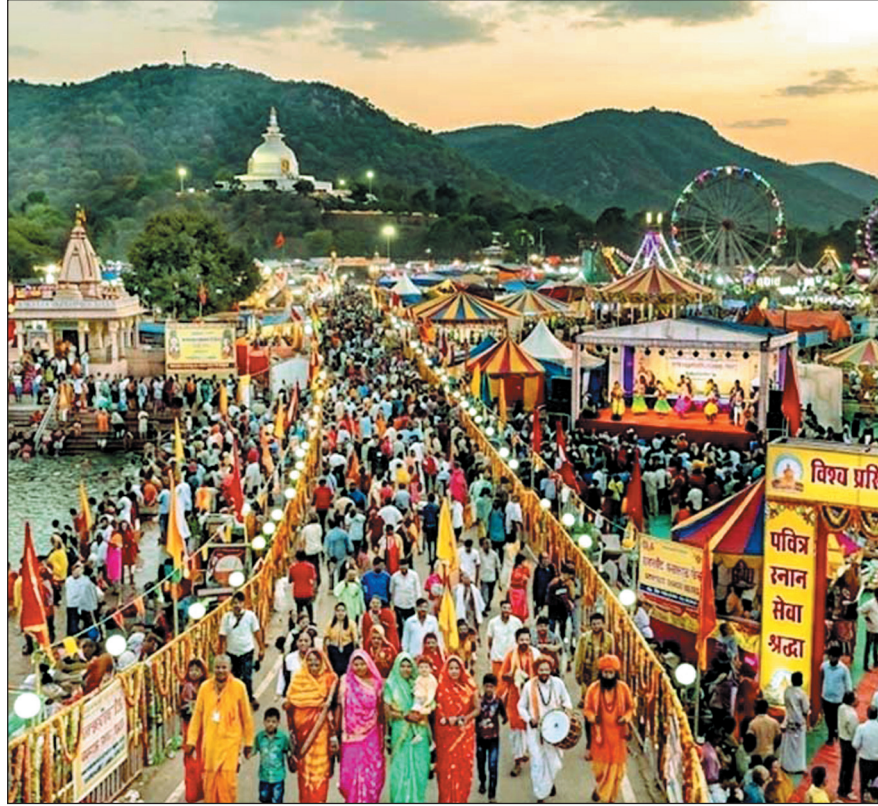
राजगीर, बिहार में सज-धज कर तैयार हो गया है राजगीर का कुंड इस क्षेत्र में आज से शुरू हो गया है ऐतिहासिक मलमास मेला.