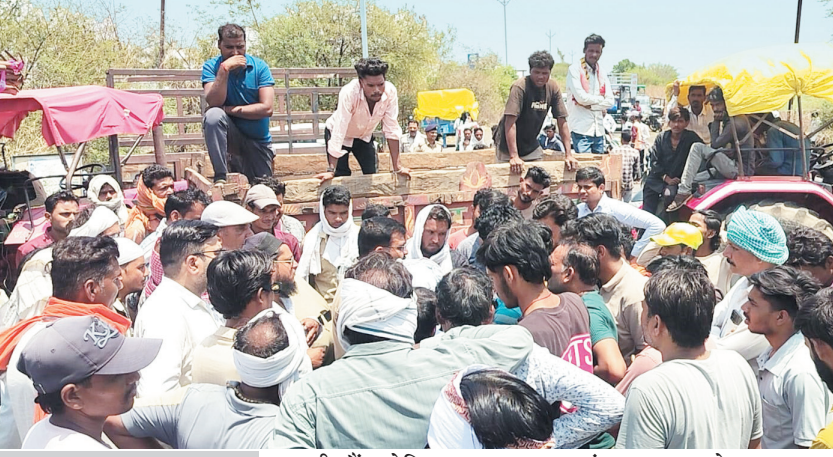
सिलवानी-उदयपुर रोड पर करीब एक घंटे तक यातायात बाधित, प्रशासन ने बढ़ाए तुलाई काटे

सिलवानी, 10 मई. स्टेट हाईवे-44 स्थित सिलवानी-उदयपुर रोड पर रविवार चिलचिलाती धूप में किसानों ने गेहूँ तुलाई में हो रही देरी को लेकर चक्काजाम कर विरोध प्रदर्शन किया. बड़ी संख्या में किसान सड़क पर बैठ गए, जिससे हाईवे के दोनों ओर वाहनों की लंबी कतारें लग गईं और यातायात करीब एक घंटे तक प्रभावित रहा.