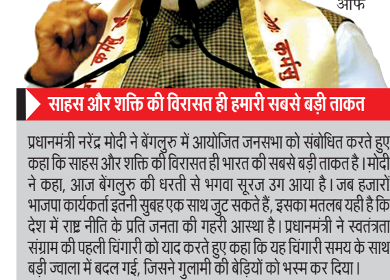
साहस और शक्ति की विरासत ही हमारी सबसे बड़ी ताकत

डिजल का हमें कम उपयोग करने होंगे. साथ ही उन्होंने कहा कि डिजिटल क्रांति ने भारत को वैश्विक आधार बताया. पीएम ने तेलंगाना के सीएम के. चंद्रशेखर रेड्डी को सुझाव देते हुए कहा कि अच्छा है मेरे से ही जुड़ें. वहीं, उन्होंने बताया कि बंगलुरु में 250 एकड़ में फैला आर्ट ऑफ लिविंग का लोकार्पण