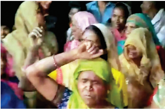
ग्रामीणों का गुस्सा शांत हुआ और वे घर लौट गए.

रायसेन, 8 मई. जिले के नूरांज थाना क्षेत्र के प्राचीन देवस्थान के पास नई शराब दुकान खुलने पर ग्रामीणों रोष हैं. स्वर्गीय मुख्यमंत्री सुंदरलाल पटवा के नाम पर बने यात्री प्रतीक्षालय को शराबियों का अड्डा बनाने के विरोध में ग्रामीणों और हिंदूवादी संगठनों ने धरना-प्रदर्शन किया.