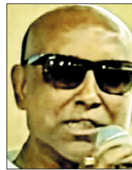
मंत्री रथिन घोष