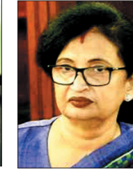
मंत्री चंद्रिमा भट्टाचार्य