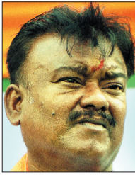
मंत्री बेचारा मन्ना