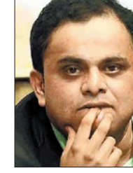
मंत्री ब्रात्या बासु