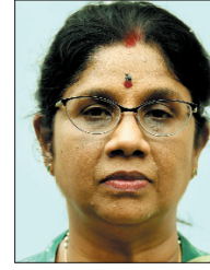
मंत्री शशि पंजा