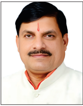
डायरी राज्यमंत्री (स्वतंत्र प्रभार) लखन पटेल भी उपस्थित रहेंगे. दुग्ध उत्पादन के क्षेत्र में मध्यप्रदेश

भोपाल, 3 मई. मुख्यमंत्री डॉ. मोहन यादव सोमवार को ग्वालियर में राज्य स्तरीय दुग्ध उत्पादक एवं पशुपालक सम्मेलन का शुभारंभ करेंगे. मुख्यमंत्री डॉ. यादव विभागीय योजनाओं के अंतर्गत लाभान्वित हितग्राहियों को स्वीकृति प्रमाण-पत्र भी वितरित करेंगे. मेला ग्रांड ग्वालियर में होने वाले सम्मेलन में पशुपालन एवं