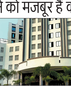
कर्मचारी कार्य कर रहे हैं. नहीं है कूलर की व्यवस्था नवीन भवन में दो महीने होने के बाद भी कर्मचारियों को गर्मी से राहत देने के लिए कोई व्यवस्था

जिसमें सबसे प्रमुख तो पीने का पानी, दूसरा ठंडी हवा, तीसरा खिड़कियों के पर्दे नहीं होना. इस कारण कर्मचारी गर्मी झेलने को मजबूर हैं. इस भवन में लगभग दो महीने से निगम के अधिकारी और