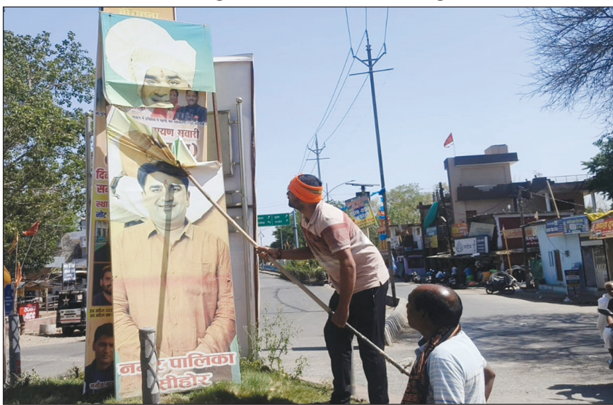
सीहोर. नया परिषद द्वारा शहर में बंदनुमा दाग की तरह नजर आने वाले पलेक्स और बेनर हटाने का काम शुरू कर दिया गया है.

नगर पालिका परिसर में आयोजित प्रेस वार्ता में स्वच्छता सर्वेक्षण 2024-25 की उपलब्धियों की समीक्षा करते हुए आगामी रणनीति पर विस्तार से चर्चा की गई. इस दौरान बताया गया कि पिछले वर्ष सीहोर ने 1 लाख से 3 लाख आबादी वाले शहरों की श्रेणी में राष्ट्रीय स्तर पर