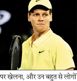
पर खेलना, और उन बहुत से लोगों के सामने खेलना जिन्हें मैं जानता हूँ और जो मेरा समर्थन करने आए हैं, यह बहुत खास है. मैं कल एक और मैच खेलने को लेकर बहुत उत्साहित हूँ. यह एक और मौका है. मुझे अच्छी तरह से रिकवर करना होगा और मैच की तैयारी जितनी हो सके उतनी अच्छी तरह से करनी होगी, क्योंकि यह एक और मुश्किल मैच होगा.'