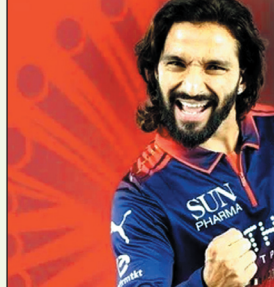
टाइटन्स का प्रदर्शन इस सीजन में उतार-चढ़ाव भरा रहा है, जिसमें उसे चार जीत और चार हार मिली हैं, जिससे वह पॉइंट्स टेबल में बीच में फंसी हुई है और उसका नेट

अहमदाबाद, 29 अप्रैल मौजूदा चैंपियन रॉयल चैलेंजर्स बेंगलुरु आईपीएल 2026 प्लेऑफ की दौड़ में अपनी पकड़ और मजबूत करने की कोशिश करेगी, जब गुरुवार को यहाँ नरेंद्र मोदी स्टेडियम में सीजन के 42वें मैच में उसका सामना गुजरात टाइटन्स से होगा. आरसीबी इस मुकाबले में जबरदस्त फॉर्म में उतर रही है, उसने अपने आठ में से छह मैच जीते हैं और 1.919 के शानदार नेट रन रेट के साथ पॉइंट्स टेबल पर दूसरे स्थान पर है. वहीं, गुजरात