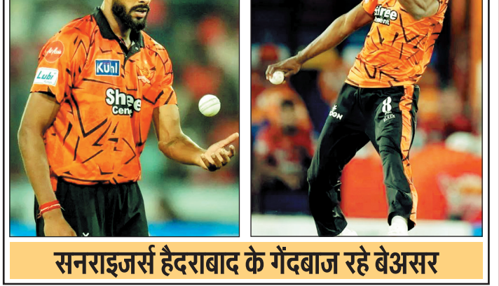
सनराइजर्स हैदराबाद के गेंदबाज रहे बेअसर