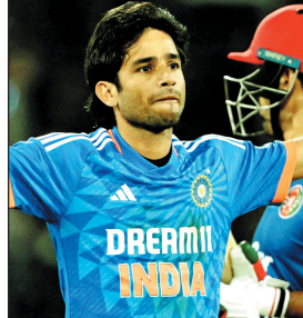
लेग स्पिनर के लिए बाहर करते हैं, तो इससे उनका आत्मविश्वास बुरी तरह प्रभावित होगा. 'पंजाब किंग्स के खिलाफ पुंजा आरआर के सबसे सफल गेंदबाज रहे और उन्होंने चार विकेटों में से दो विकेट लिए'

नयी दिल्ली, 29 अप्रैल पूर्व क्रिकेटर अभिनव मुकुंद का मानना है कि अच्छी फॉर्म में चल रहे रवि बिश्नोई को ड्रॉप करने से उनका आत्मविश्वास प्रभावित होगा. एक टाइमआउट शो में अभिनव मुकुंद ने कहा, 'मैं यश राज को खिलाने के फ्रंसले से पूरी तरह सहमत नहीं हूँ, क्योंकि मेरा मानना है कि आईपीएल में लंबे समय तक सफल रहने वाली टीमों ने अपने गेंदबाजों या भारतीय खिलाड़ियों का एक मजबूत कोर बनाए रखा है. और खासकर जब रवि बिश्नोई ने अच्छी गेंदबाजी की है. अगर आप उन्हें किसी दूसरे