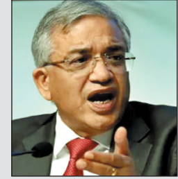
चुनावों की प्रक्रिया देखेंगे 17 देशों के प्रतिनिधि

नयी दिल्ली, 21 अप्रैल. चुनाव आयोग (ईसीआई) ने इस समय जारी विधान सभा चुनाव के दूसरे चरण में तमिलनाडु और पश्चिम बंगाल में अंतर्राष्ट्रीय आगंतुकों को चुनाव प्रक्रिया दिखाने के कार्यक्रम का आयोजन किया है जिसमें 17 देशों के 34 प्रतिनिधि हिस्सा लेंगे. आयोग ने पहले चरण में नौ अप्रैल को हुए चुनाव के लिए भी इसी तरह का अंतर्राष्ट्रीय चुनाव अतिथि कार्यक्रम आयोजित किया था. मुख्य चुनाव आयुक्त ज्ञानेश कुमार ने मंगलवार को इस कार्यक्रम के दूसरे चरण का राजधानी के इंडिया इंटरनेशनल इंस्टीट्यूट ऑफ डेमोक्रेसी एंड इलेक्शन मैनेजमेंट (3आइडएम) में संस्थान में उद्घाटन किया. दूसरे चरण में शामिल प्रतिनिधियों में कुछ देशों के दिल्ली स्थित राजनयिक मिशनों के प्रतिनिधि और 'इंटरनेशनल आइडिया' के एक प्रतिनिधि शामिल हैं.