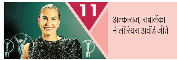
11 अलका राज, सबालेंका ने लॉरियस अवॉर्ड जीते