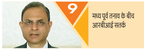
9 मध्य पूर्व तनाव के बीच आरबीआई सतर्क