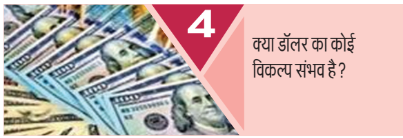
4 क्या डॉलर का कोई विकल्प संभव है ?