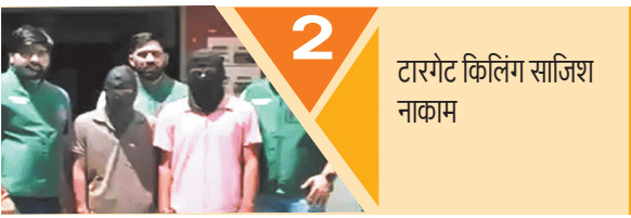
2 टारगेट किलिंग साजिश नाकाम