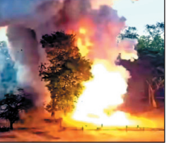
केरल के त्रिशूर में हुआ हादसा

केरल, 21 अप्रैल. त्रिशूर जिले के मुंडथिवकोडु इलाके में मंगलवार को एक पटाखा निर्माण यूनिट में भीषण विस्फोट हुआ, जिसमें 13 लोगों की मौत हो गई और कई अन्य घायल हो गए. यह हादसा उस समय हुआ जब प्रसिद्ध त्रिशूर पूरम की तैयारियां चल रही थीं. जानकारी के अनुसार, विस्फोट के समय यूनिट में करीब 40 लोग काम कर रहे थे. धमाके के बाद पूरे इलाके में आंशका जताई जा रही है कि विस्फोटक सामग्री के भंडारण और सुरक्षा मानकों में लापरवाही इसके पीछे कारण हो सकती है. धमाका इतना जोरदार था कि इसकी आवाज कई किलोमीटर दूर तक सुनी गई. घटना के बाद पुलिस, फायर ब्रिगेड और आपातकालीन टीमों मौके पर पहुंच गईं और इलाके को घेर लिया गया. प्रशासन ने लोगों से घटनास्थल से दूर रहने की अपील की है और पूरे मामले की जांच शुरू कर दी गई है.