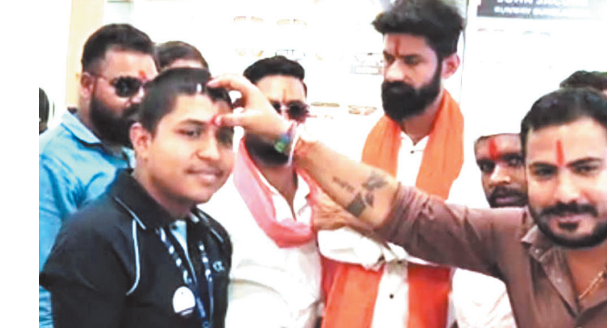
विंदी या माथे पर सिंदूर जैसे धार्मिक चिन्हों को दिखाने पर रोक है. हालांकि इस दस्तावेज को प्रामाणिकता को किसी भी आधिकारिक स्तर पर पुष्टि नहीं हुई है. इसी कथित जानकारी के

इस कथित दस्तावेज में धार्मिक प्रतीकों को लेकर आपत्तिजनक दिशा-निर्देश होने का दावा किया गया था, जिसमें यह कहा गया था कि हिजाब की अनुमति है, लेकिन कलावा,