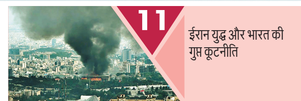
11 ईरान युद्ध और भारत की गुप्त कूटनीति