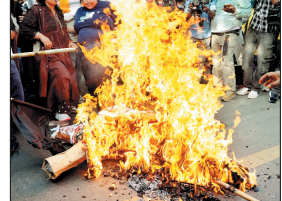
की आधी आबादी इसे कभी माफ नहीं करेगी.

नई दिल्ली, 18 अप्रैल. महिला आरक्षण बिल पास न हो पाने के बाद देश की राजनीति गरमा गई है. भाजपा ने कांग्रेस और विपक्ष पर जोरदार हमला करते हुए दिल्ली में बड़ा प्रदर्शन किया. कई वरिष्ठ भाजपा नेता और महिला सांसद समर्थकों के साथ कांग्रेस नेता राहुल गांधी के घर तक मार्च करते हुए पहुंचे.