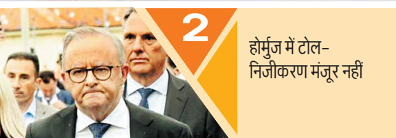
2 होर्मुज में टोल-निजीकरण मंजूर नहीं