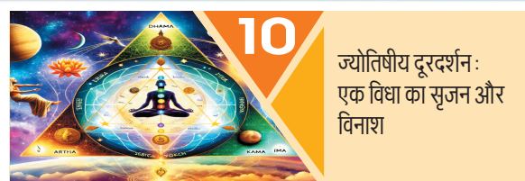
10 ज्योतिषीय दूरदर्शन: एक विद्या का सृजन और विनाश