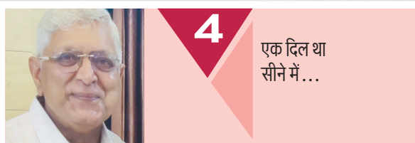
4 एक दिल था सीने में...