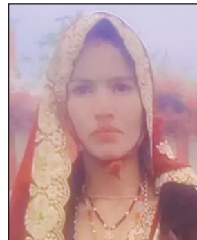
इलाके में सनसनी फैल गई और युवती के घर के बाहर लोगों की

पुलिस ने शव का पंचनामा बनाकर उसे पोस्टमार्टम के लिए खिलचीपुर अस्पताल भेजने की प्रक्रिया शुरू कर दी है और आत्महत्या के कारणों का पता लगाने के लिए परिजनों व पड़ोसियों से पूछताछ कर रही है. पुलिस घटना की जांच में जुटी प्रारंभिक जांच में युवती द्वारा फांसी लगाने के कारणों का अभी तक कोई खुलासा नहीं हो पाया है. घटना की जानकारी मिलते ही