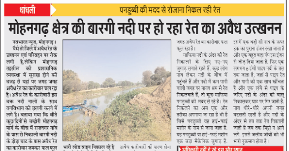
मोहनगढ़ क्षेत्र की बारगी नदी पर हो रहा रेत का अवैध उत्खनन