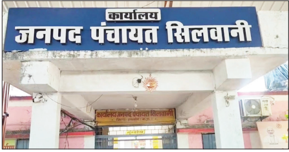
कर दोषियों पर कार्रवाई की मांग उठाई है.

ग्रामीणों ने आरोप लगाया है कि पंचायत के जिम्मेदारों ने मिलकर तालाब निर्माण के नाम पर सरकारी राशि निकाल ली लेकिन धरातल पर कोई कार्य नहीं हुआ. मामले को लेकर गांव में आक्रोश है और ग्रामीणों ने जांच