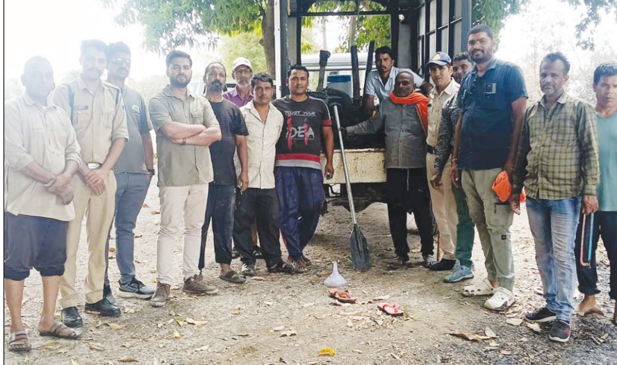
सीहोर. पेयजल के लिए काहिरी बंधान में संरक्षित पानी की चोरी करते किसानों की मोटर को नगरपालिका के अमले द्वारा जब्त किया गया.

जिले में इस वर्ष अल्पवर्षा के चलते सभी जलस्रोतों में पानी का स्तर लगातार घटता जा रहा है. ऐसे हालात में शहर की पेयजल आपूर्ति बनाए रखना प्रशासन के लिए बड़ी चुनौती बन गया है. इसी को ध्यान में रखते हुए जिला प्रशासन ने शहरवासियों की प्यास बुझाने के लिए प्रमुख जलस्रोत जमोनिया तालाब, भगवानपुरा