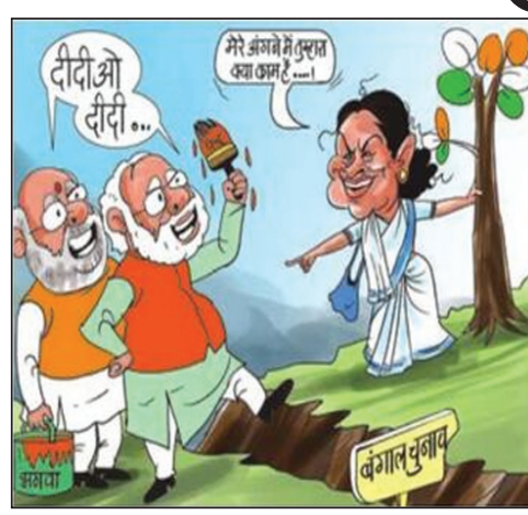
चाहिए कि ओपीनियन पोल में बीजेपी के सारे मंसूबे ध्वस्त हो गए हैं और बंगाल में चौथी बार ममता सरकार बनने जा

पड़ोसी ने हमसे कहा, 'निशानेबाज, देश मलेरिया मुक्त हो चुका है लेकिन बंगाल ममता मुक्त कैसे होगा? बीजेपी छटपटा रही है कि बंगाल में भगवा लहराए, क्या मोदी अपने मन की मुराद पूरी कर पाएंगे? बंगाल के लोग यदि जय जय श्रीराम कहने लगे तो उनका बेड़ा पार हो जाएगा.' हमने कहा, 'कोशिश करने वालों की हार नहीं होती. बीजेपी भारी पड़े, इसके लिए सुबुद्ध अधिकारी को जिम्मेदारी सौंपी गई है. बीजेपी की प्लानिंग है कि ममता बनर्जी को उनके निर्वाचन क्षेत्र में इस तरह धेरकर दबाव बनाया जाए ताकि वह चुनाव प्रचार के लिए राज्य के अन्य क्षेत्रों में जाने ही न पाएँ और अपनी सीट बचाने की उधेड़बुन में लगी रहें. जिस तरह अमेरिका व इजराइल ने ईरान को निशाना बनाया है वैसे ही बीजेपी टीएमसी पर टूट पड़ेगी. मोदी, अमित शाह, योगी आदित्यनाथ, जेपी नड्डा सब मिलकर टीएमसी को दफनाने के लिए गड्डा खाद देंगे.'