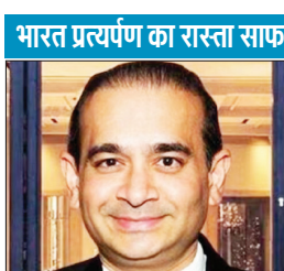
भारत प्रत्यर्पण का रास्ता साफ

लंदन स्थित रॉयल कोर्ट ऑफ जस्टिस की खंडपीठ ने फैसले में कहा कि अपील को दोबारा खोलने के लिए असाधारण परिस्थितियों की आवश्यकता होती है, जो इस मामले में मौजूद