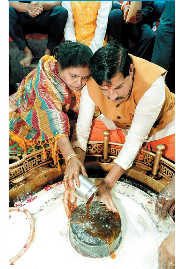
उज्जैन में मुख्यमंत्री डॉ. मोहन यादव ने श्री अंगारेश्वर महादेव का सपलीक पूजन, दर्शन कर अभिषेक किया.