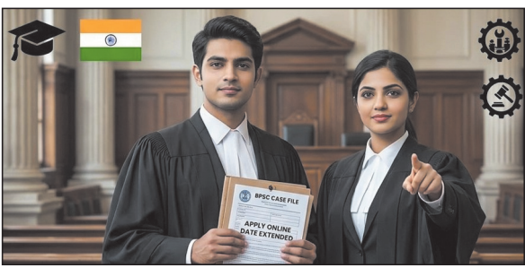
जज पदों पर भर्ती की अधिसूचना जारी की गई है. इस भर्ती के

सबसे पहले बात करें पहनावे की, तो उम्मीदवार को साफ-सुथरे और सादे कपड़े पहनने चाहिए. पुरुष उम्मीदवार हल्के रंग की शर्ट और गहरे रंग की पैंट पहन सकते हैं, साथ में साफ जूते होना जरूरी है. वहीं महिला उम्मीदवार सादे सूट या साड़ी में भी प्रोफेशनल लुक रख सकती हैं. बहुत ज्यादा चमक-दमक या फैशन वाला पहनावे