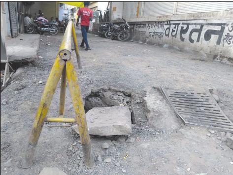
दर्जन भर से अधिक जगह चेम्बर टूटे-फूटे पड़े हैं. इसके कारण दुर्घटनाएं, बाईक सवारों का चोटिल होना, मवेशियों का घायल होना जैसी घटनाएं आए दिन हो रही हैं.