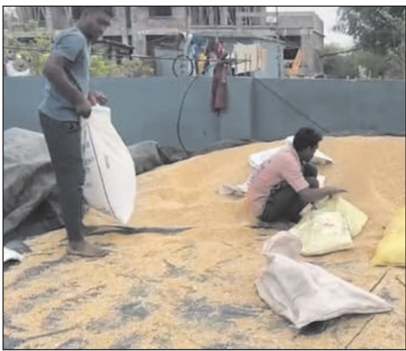
उपज को सहेजने की कवायद में जुटे किसान

► मंडी में और खलिहान में अनाज भीगने से बढ़ी परेशानी ► सीहोर तहसील में 2.2 एमएम व इच्छावर में 9 एमएम बारिश