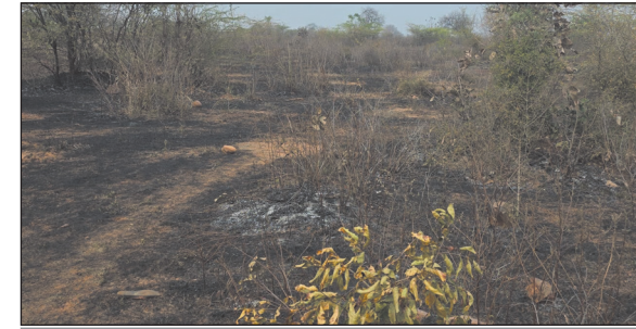
सतर्कता से बची लाखों पौधों की जान

नवभारत न्यूज गुना 20 मार्च का। फतेहगढ़ वन परिक्षेत्र के बरोदिया प्लांटेशन में बीती रात अचानक लगी भीषण आग ने वन विभाग और स्थानीय प्रशासन की सांसें फूला दीं। हालांकि, सूचना मिलते ही वन विभाग के अधिकारियों और कर्मचारियों ने सक्रियता दिखाते हुए मोर्चा संभाला, जिसके चलते प्लांटेशन का एक बड़ा हिस्सा जलने से बच गया।