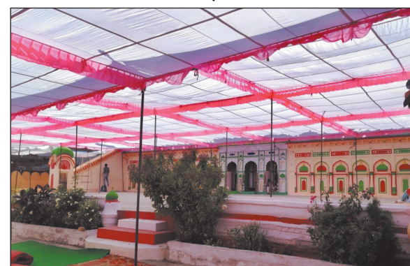
लोग एक दूसरे के घर मिलने के लिए जाते हैं।

रमजान माह की समाप्ति के बाद आज मनेगी ईद मुस्लिम समाज के घरों में बनाए गए विभिन्न पकवान