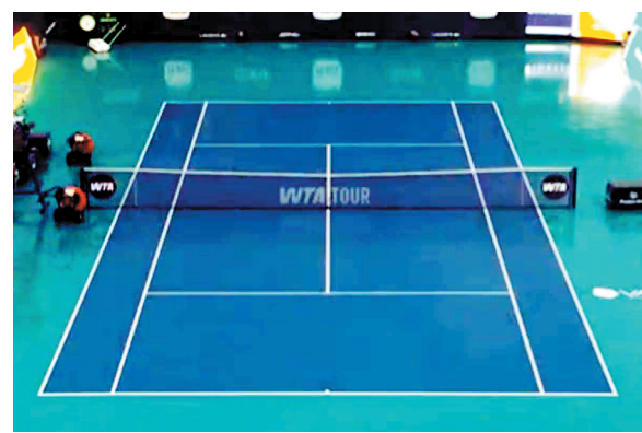
आयोजकों के सामने सबसे बड़ी चुनौती यह है कि वे इतने सारे मुकामलों को कम समय में कैसे पूरा कराएं. इस मौसम की मार का असर बड़े खिलाड़ियों पर भी साफ देखने को मिला. महिला वर्ग की शीर्ष वरीयता प्राप्त खिलाड़ी आर्याना सबालेंका को अपनी प्रैक्टिस बीच में ही छोड़नी पड़ी. उन्होंने सोशल मीडिया पर बारिश का वीडियो साझा करते हुए मजाकिया अंदाज में लिखा कि आज अभ्यास की जरूरत ही नहीं है. वहीं पुरुष वर्ग के शीर्ष खिलाड़ी कार्लोस अल्कराज को भी खराब मौसम के कारण अपना अभ्यास सत्र रद्द करना पड़ा. गोले कोर्ट पर खेलना संभव नहीं था, जिससे उनकी तैयारी अधूरी रह गई.

18 मार्च को हालात और खराब हो गए, जब पूरे दिन बारिश जारी रही और आयोजकों को सभी निर्धारित मुकामलों रद्द करने का फैसला लेना पड़ा. एटीपी और डब्ल्यूटीए दोनों वर्गों के कुल 37 मैच रद्द किए गए, जिससे टूर्नामेंट पर भारी दबाव बन गया है. अब