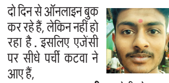
सनी, बरखेड़ी भोपाल

सुबह से रिफिल ऑनलाइन बुक नहीं हो रही है. इसलिए एजेंसी पर गैस सिलेंडर लेने आना पड़ा है.