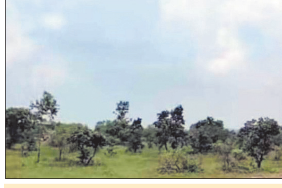
उल्लेखनीय है कि मार्च महीने के पहले ही सप्ताह में गर्म हवाओं ने दस्तक दे दी है। धूप में तेजी है और सूरज आग बरसाने लगा है। ऐसे में अभी से अप्रैल और मई महीने वाला अहसास होने लगा है। तेज और तीखी धूप के चलते लोग रास्ते में दुकानों के शेड और पेड़ों की छांव तलाशने लगे हैं।

नवभारत न्यूज ब्यावरा 10 मार्च, का. मार्च के पहले सप्ताह ही ठण्ड ने मार्च पास्ट कर दिया है। वहीं ग्रीष्म ऋतु आने से पहले ही गर्मियों का अहसास होने लगा है। मंगलवार को दिन का अधिकतम तापमान लगभग 36 डिग्री के आसपास आंका गया। वहीं न्यूनतम तापमान 18 डिग्री दर्ज किया गया है। मौसम ने होली के बाद अपने तेवर तेज कर दिए हैं। अभी से गर्मियों का अहसास होने लगा है।