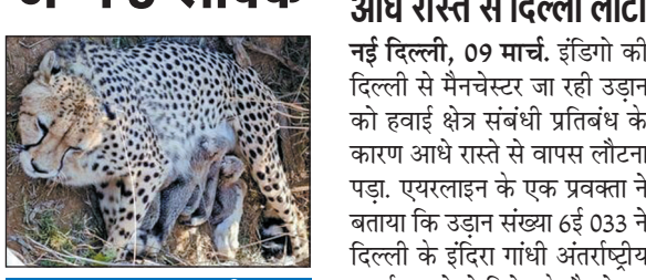
अब भारत में कुल 53 चीते हुए

श्रयोपुर, 09 मार्च. श्रयोपुर के कूनों ने नेशनल पार्क से फिर खुशाखबरी आई है. नामीबियाई मादा चीता ज्वाला ने 5 स्वस्थ शावकों को जन्म दिया है. इसके साथ ही अब भारत में चीतों की कुल संख्या बढ़कर 53 हो गई है. वन विभाग के अधिकारियों ने बताया कि ज्वाला और उसके पांचों नवजात शावक पूरी तरह स्वस्थ हैं. विशेषज्ञों की टीम सीसीटीवी और मैदानी निगरानी के जरिए शावकों की सुरक्षा और स्वास्थ्य पर नजर रख रही है. मुख्यमंत्री डॉ. मोहन यादव ने सोशल मीडिया के माध्यम से इस जानकारी को साझा करते हुए इसे