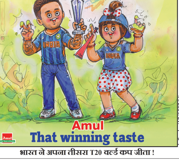
भारत ने अपना तीसरा T20 वर्ल्ड कप जीता!