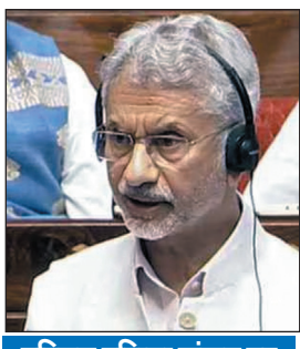
पश्चिम एशिया संकट पर जयशंकर का बड़ा बयान

नयी दिल्ली, 09 मार्च. उच्चतम न्यायालय ने सोमवार को उस जनहित याचिका को सुनने से इनकार कर दिया, जिसमें आयकर विभाग की छपेमारी की शक्तियों को चुनौती दी गयी थी. याचिकाकर्ता ने आयकर अधिनियम के उन नियमों पर सवाल उठाये थे, जो टैक्स चोरी की जांच के दौरान बिना किसी पूर्व सूचना के तलाशी, जब्ती और डिजिटल डेटा (जैसे मोबाइल, ईमेल, क्लाउड स्टोरेज) खंगालने की अनुमति देते हैं. इस याचिका में आयकर अधिनियम 1961 के मौजूदा नियमों और एक अप्रैल से लागू होने वाले आयकर अधिनियम 2025 के नए ढांचे पर आपत्ति जताई गई थी.