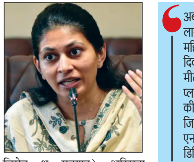
विमन थ्रू एक्शन) अस्मिता कार्यक्रम के तहत देशभर में 250 जगहों पर एथलेटिक्स लीग का शुभारंभ करते हुए यह बात कही. इस दौरान केंद्रीय राज्य मंत्री ने अस्मिता बैनर के तहत योग, वुशु, किकबॉक्सिंग और वेटलिफ्टिंग

औरंगाबाद, 8 मार्च. खेल राज्य मंत्री रक्षा निखिल खडसे ने रविवार को कहा कि समर ओलंपिक गेम्स और दूसरे मल्टी-डिस्प्लिन प्रतिযোগिताओं में भारत के पदकों की संख्या में तभी सुधार हो सकता है जब स्पोर्ट्स में महिलाओं की भागीदारी कई गुना बढ़े. तथा हर जिला स्पोर्ट्स में एक्टिव हो. हर बेटे कॉम्पिडेंट हो और फिटनेस राष्ट्रीय आदत बन जाए. राज्यमंत्री खडसे ने रविवार को यहां छत्रपति सांभाजीनगर के गरखेड़ा में डिजिटल स्पोर्ट्स कॉम्प्लेक्स में अंतरराष्ट्रीय महिला दिवस के अवसर पर (अचीविंग स्पोर्ट्स माइलस्टोन बाय इंसपयारिंग