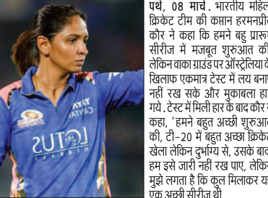
पर्थ, 08 मार्च. भारतीय महिला क्रिकेट टीम की कप्तान हरमनप्रीत कौर ने कहा कि हमने बहु प्रारूप सीरीज में मजबूत शुरुआत की, लेकिन वाका ग्राउंड पर ऑस्ट्रेलिया के खिलाफ एकमात्र टेस्ट में लय बनाए नहीं रख सके और मुकाबला हार गये. टेस्ट में मिली हार के बाद कौर ने कहा, 'हमने बहुत अच्छी शुरुआत की, टी-20 में बहुत अच्छा क्रिकेट खेला लेकिन दुर्भाग्य से, उसके बाद, हम इसे जारी नहीं रख पाए, लेकिन मुझे लगता है कि कुल मिलाकर यह एक अच्छी सीरीज थी.