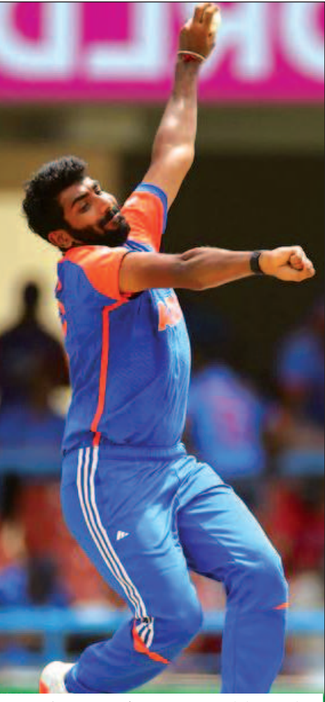
बुमराह प्लेयर ऑफ द मैच: फाइनल मुकाबले में 15 रन देकर 4 विकेट लेने वाले जसप्रीत बुमराह प्लेयर ऑफ द मैच रहे.