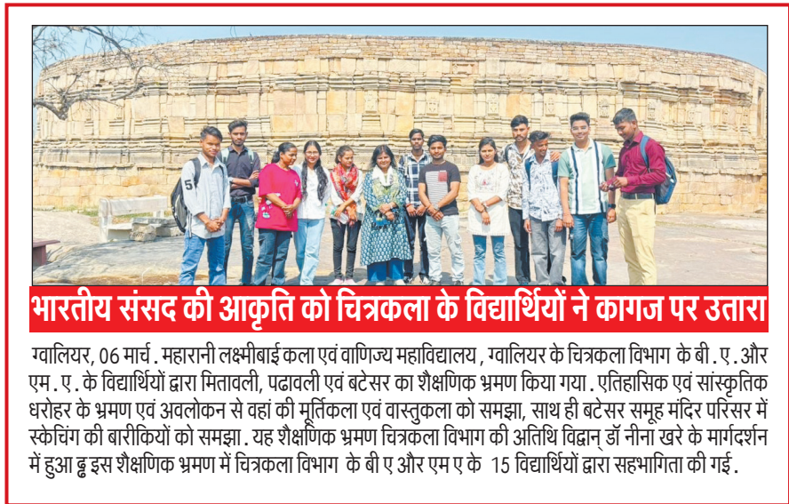
भारतीय संसद की आकृति को चित्रकला के विद्यार्थियों ने कागज पर उतारा