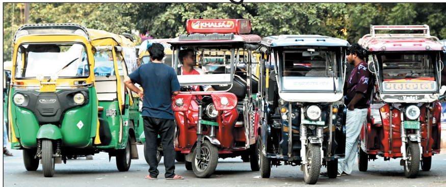
क्या पुलिस इन अराजक तत्वों के खिलाफ असहाय नजर आ रही है

नवभारत रिपोर्टर भोपाल, 23 फरवरी. शहर के बीचोंबीच स्थित शहर के प्रमुख इलाके बोर्ड ऑफिस चौराहे से प्रगति चौराहे की तरफ जाने वाले मार्ग पर यातायात व्यवस्था में कोई सुधार नहीं हो पा रहा है. जिम्मेदार ट्रैफिक पुलिसकर्मी भी व्यवस्था में सुधार करते हुए नजर नहीं आते हैं. देर शाम को पीक आवर्स में ऑटो और ई-रिक्शा चालकों की मनमानी का सिलसिला यहां हर