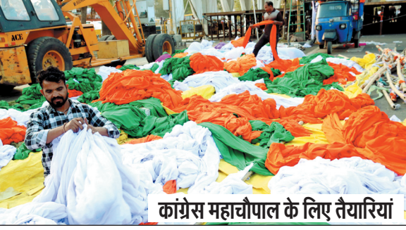
कांग्रेस महाचौपाल के लिए तैयारियां

कांग्रेस का किसान महा-चौपाल कार्यक्रम नवभारत रिपोर्टर भोपाल, 23 फरवरी. यातायात पुलिस ने मंगलवार को कांग्रेस की ओर से जवाहर चौक क्षेत्र में सुबह 10 बजे से किसान महा-चौपाल कार्यक्रम के आयोजन को लेकर शहर के प्रमुख मार्ग परिवर्तित किए गए हैं. यातायात पुलिस की तरफ से जारी निर्देशानुसार महाचौपाल का कार्यक्रम प्रस्तावित है. कार्यक्रम में कांग्रेस अध्यक्ष मल्लिकार्जुन खरगे और वरिष्ठ नेता राहुल गांधी भी शामिल होंगे. कार्यक्रम में शामिल होने वाले व्यक्तियों के