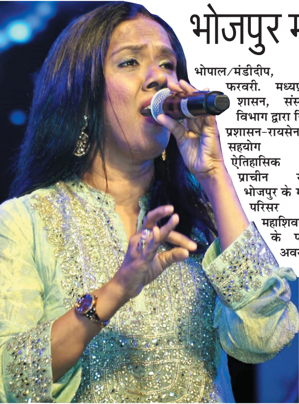
भोपाल/मंडीदीप, 16 फरवरी. मध्यप्रदेश शासन, संस्कृति विभाग द्वारा प्रशासन-रायसेन के सहयोग से ऐतिहासिक एवं प्राचीन स्थल भोजपुर के मंदिर परिसर में महाशिवरात्रि के पावन अवसर पर तीन दिवसीय 'महादेव' भोजपुर महोत्सव का आयोजन किया जा रहा है.

भोजपुर मंदिर परिसर में आयोजन, तीन दिवसीय सांस्कृतिक महोत्सव का दूसरा दिन