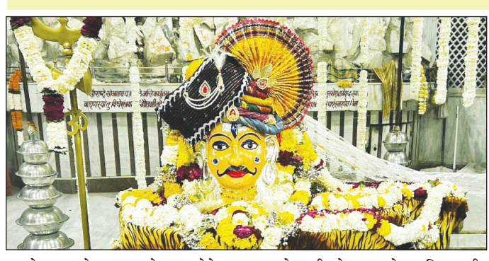
महादेव, नादेश्वर महादेव, कोदेश्वर महादेव, पीपलेश्वर महादेव सहित प्राचीन