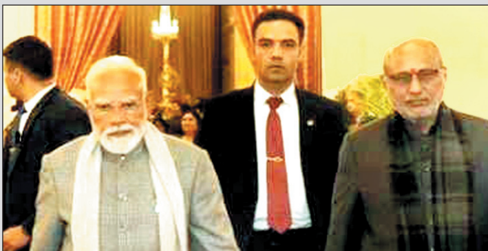
उनका बलिदान प्रत्येक नागरिक को एक दिशा में काम करने के लिए प्रेरित करता मजबूत और सुरक्षित भारत के निर्माण की

उपराष्ट्रपति राधाकृष्णन ने पुलवामा आतंकवादी हमले में जान गंवाने वाले बहादुर सुरक्षाकर्मियों को श्रद्धांजलि अर्पित की। श्री राधाकृष्णन ने सोशल मीडिया एक्स पर एक पोस्ट में कहा, सुरक्षाकर्मियों का सर्वोच्च बलिदान देश की स्मृति में सदैव अंकित रहेगा। उन्होंने कहा कि