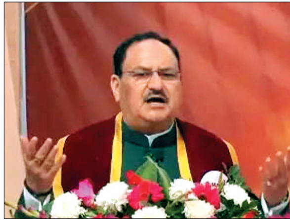
स्वास्थ्य प्रगति का महत्वपूर्ण स्तंभ बताते हुए कहा कि यहां से निकलने वाले युवा राज्य और राष्ट्र की शक्ति हैं। उन्होंने आयुष्मान

जॉलीग्रांट/त्र्यंकिेश 14 फरवरी। केन्द्रीय स्वास्थ्य मंत्री जेपी नड्डा ने कहा है कि शिक्षा केवल व्यक्तिगत उपलब्धि नहीं, बल्कि मानवता की सेवा का दायित्व भी है। उन्होंने युवाओं से समाज के अंतिम व्यक्ति तक विकास का लाभ पहुंचाने की अपील करते हुए अमृतकाल के आगामी 25 वर्षों को देश के लिए निर्णायक बताया। श्री नड्डा आज रिचीकेश में स्वामी राम हिमालयन विश्वविद्यालय के आठवें दीक्षांत समारोह में मुख्य अतिथि के रूप में बोल रहे थे। समारोह में मुख्यमंत्री पुष्कर सिंह धामी विशिष्ट अतिथि के रूप में उपस्थित रहे। दीक्षांत समारोह में कुल 1001 छात्र-छात्राओं को डिग्रियां प्रदान की गईं। साथ ही 31 विद्यार्थियों को अकादमिक उत्कृष्टता पुरस्कार, दो को स्वामी राम बेस्ट जेजुएट अवार्ड तथा 14 शोधार्थियों को पीएचडी उपाधि से सम्मानित किया गया। मुख्यमंत्री श्री धामी ने विश्वविद्यालय को उत्तराखंड की शैक्षिक और