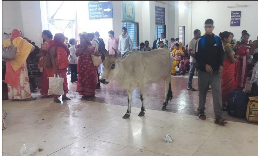
सीहोर. शहर के रेलवे स्टेशन पर अनेक अव्यवस्थाओं के अलावा आबारा मवेशियों का भी जमावड़ा बना रहता है.

सीहोर रेलवे स्टेशन पर बिना रुके निकल जाती हैं अनेक रेलगाड़ियां, हजारों यात्री होते हैं परेशान